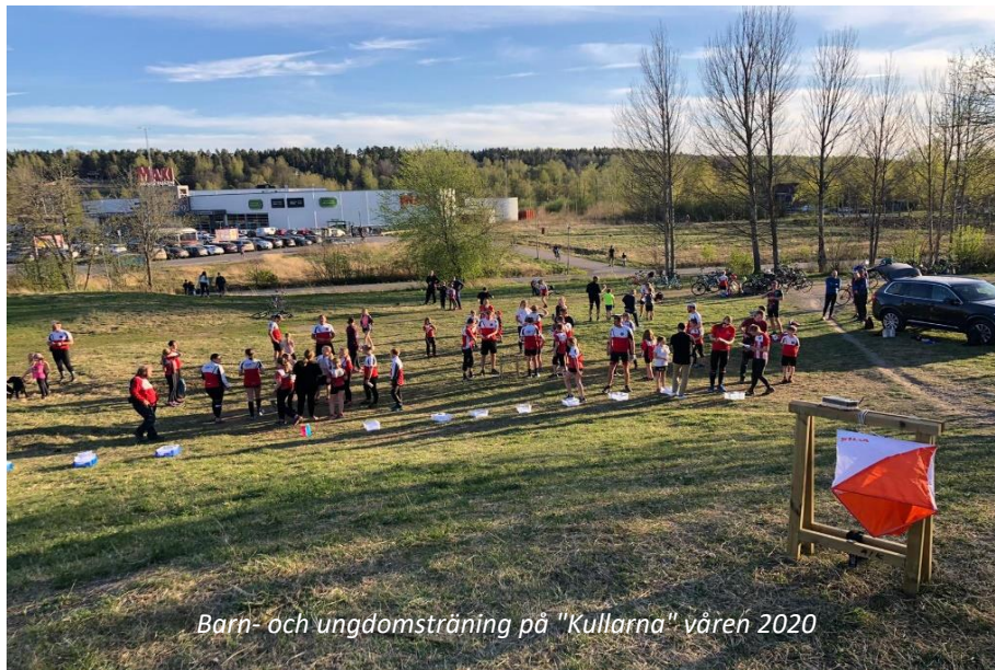
Barn- och ungdomsträning på "Kullarna" våren 2020

Den här delen av verksamhetsberättelsen handlar om orienteringsverksamheten för barn och ungdomar. Glädjande kan vi summera året 2020 med att vi trots rådande pandemi kunde erbjuda orienteringsträning för barn och ungdomar utifrån de restriktioner som gällde. Vi kan även konstatera att intresset för sporten är stor och att det har varit ett fortsatt stort antal deltagare i träningsgrupperna. Dessutom kan vi se att vi lyckats att rekrytera fler ledare och att vi nu har en positiv, bred grupp av ledare som hjälps åt och driver verksamheten. Extra roligt att det under året är två juniorer som representerat klubben på JSM och att det varit fler äldre juniorer/seniorer från andra klubbar som tränat tillsammans med klubbens äldre ungdomar i violett-svart grupp.