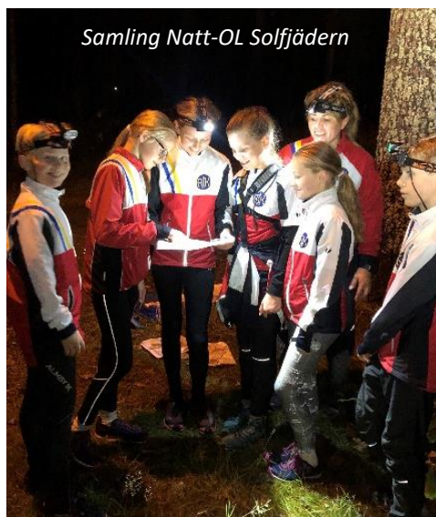
Samling Natt-OL Solfjädersn

Höstsäsong: Upptakt för klubbens gemensamma torsdagsträning var 13 augusti där alla grupperna fick möjlighet att testa på Labyrinth-OL och Micro-OL. Under höstterminen har vi haft ett samarbete med KFUM, där vi hjälpts åt att organisera teknikträningar och kontrollutsättning för två träningstillfällen per klubb. Almby IK bjöds in till träning i Karlslundskogen och Solfjädersn. Terminen avslutades traditionsenligt med "Räv-OL" och i år fick vi även besök av en åsna. Efter träningen bjöds det på korb med bröd som serveras utanför Ljungstugan.