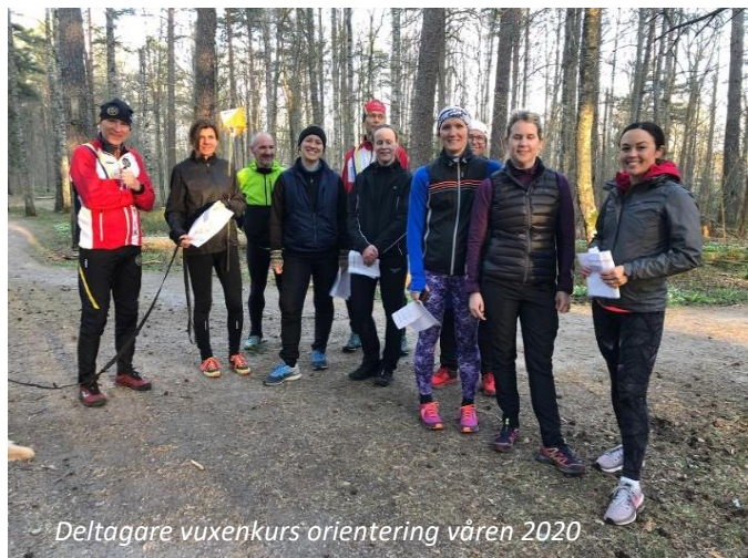
Deltagare vuxenkurs orientering våren 2020