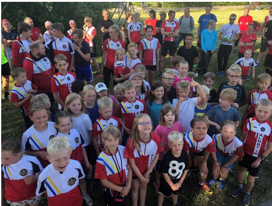
Sprinträning vid Tybbleområdet/Lergöken 7 juni

Vårtermin barn- och ungdomsträning (10 träningstillfällen för alla grupper) startades den 5 april med träning för alla träningsgrupper och samtidigt hölls föräldrainformation inne i Ljungstugan om verksamheten. Vårsäsongen avslutades den 14 juni med gemensamträning och avslutningsfika i Ljungstugan.