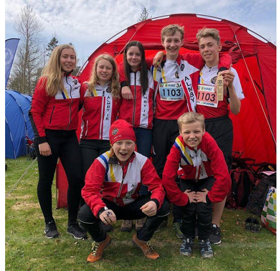
10Mila Nynäshamn med lag i ungdomsstafetten