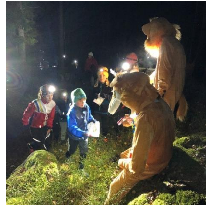
Avslutning hösttermin med rävar på besök

Höst-/vintersäsong: Fler av de äldre ungdomarna har fortsatt sin grundträning under höst-/vintersäsongen och då deltagit i organiserad distanssträning tisdagar med bansträckning mestadels efter stig = Pannlampa i Skog med karta (PISK). Under vintermånaderna erbjuds även organiserad intervallträning tillsammans med träningsgruppen "Äldre Elit" på torsdagar.