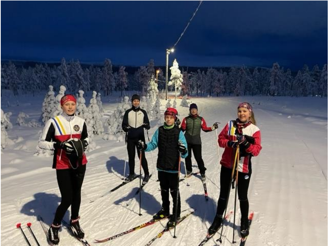
Drickspaus och "doppboll" i Idre Fjäll