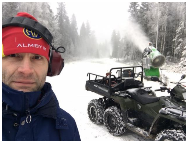
Ånnabodas konstsnöspår.

Vintern börjar ge sig till känna och förhoppningsvis är det snart dags att ta fram skidor och ge sig ut i härliga skidspår. Under helgen har Alliansens medlemmar påbörjat arbetet med att spruta snö till konstsnöspåret i Ånnaboda. Nu håller vi bara tummarna för att kylan kommer.