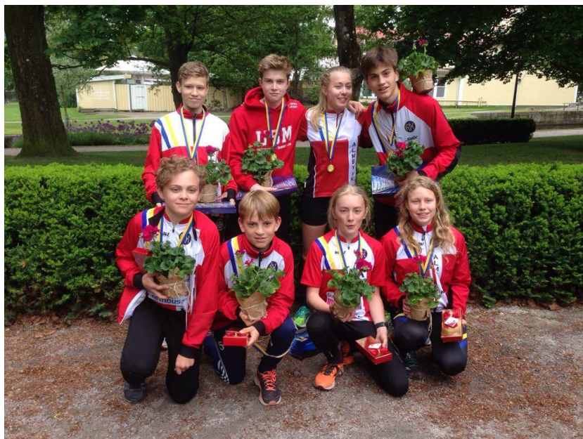
Bild: Ungdomsstafetten Örebro city sprint 2017