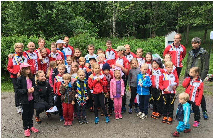
Bild: Sommaravslutning Sommaro 2017

Barn-ungdomsträning torsdagar VT-17 (10 träningstillfällen för alla grupper) startades den 16 mars med träning för alla träningsgrupper och samtidigt hölls föräldrainformation inne i Ljungstugan om verksamheten. Vårsäsongen avslutades den 8 juni med gemensamträning och avslutningsfika vid Sommaro.